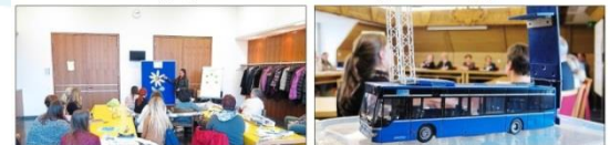
Die Workshops beim Fachtag „Deutsch als Zweitsprache“ stießen auf großes Interesse. LEO, der Jugendbetriebs- und Kulturbus, soll im kommenden Jahr auf die Route geschickt werden.